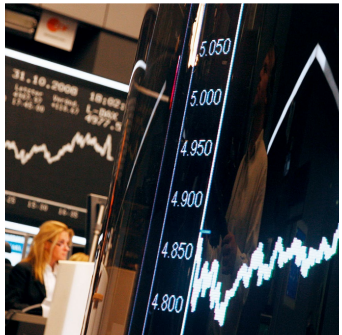
Солидная контрактная база проекта Nord Stream, который реализуется в энергетической сфере, гарантирует надежные долгосрочные инвестиции