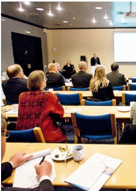
Саммит «Развитие Балтийского региона»