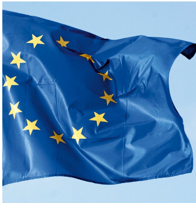
Еврокомиссия признает необходимость значительных инвестиций в развитие новых энергетических сетей

Для обеспечения надежности поставок газа в Европу необходима дополнительная инфраструктура